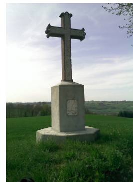
Croix du Jubilé