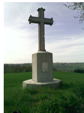
Croix du Jubilé

Rappel: Le pèlerin ou le randonneur qui chemine sur les itinéraires décrits reste seul responsable des accidents dont il serait victime ou qu'il aurait provoqués