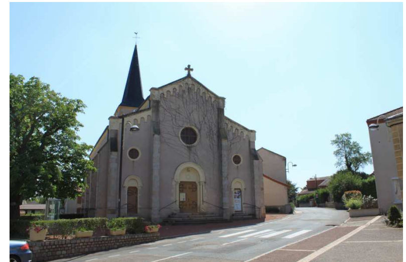
Eglise de Lentigny